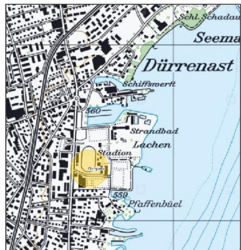
Stadion Lachen, Gwattstrasse, Thun

Wir vermitteln eine Trainingsgruppe beim Laufsportverein All Blacks. Bitte melden Sie sich bei uns.